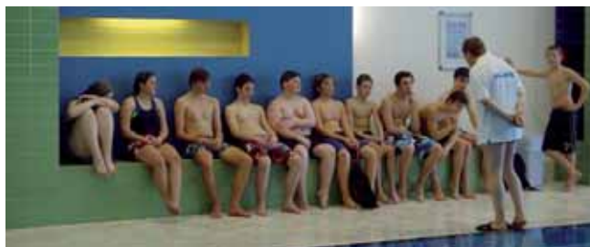
Ausbildung in der Eifel-Therme-Zikkurat