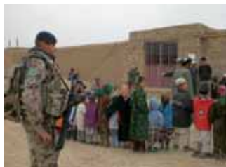
Objektschutzkräfte aus Kerpen beim Schulbesuch in einem nahe gelegenen Dorf

Nicht zuletzt durch solche Maßnahmen wie auch durch die Ausbildungsunterstützung für die afghanischen Sicherheitskräfte versuchen die Objektschützer der Luftwaffe das Bild des deutschen ISAF-Kontingents (Internationale Sicherheitsunterstützungstruppe) als guter Nachbar und Helfer in der Not zu prägen.