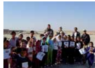
Schulkinder zeigen stolz die durch das Bataillon gespendeten Schulhefte

Doch der Auftrag der Soldaten, so führte Oberst Kubiak weiter aus, ist nicht der einzige Aspekt, der in einer solchen Stunde bewegt. Vielmehr sprach er deutlich