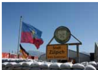
Das Zülpicher Ortsschild hat nun seinen festen Standort im Camp Marmal in der in der Nähe von Masar- e Scharif